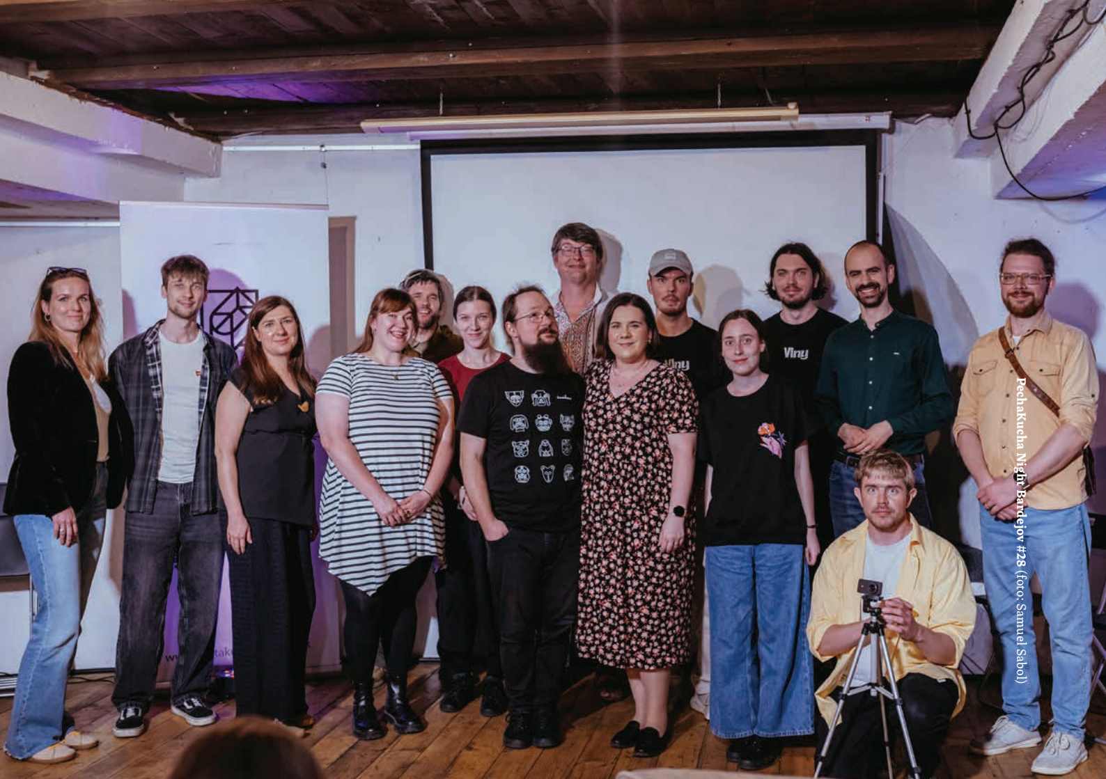
Pechakucha Night Bartoljev #28