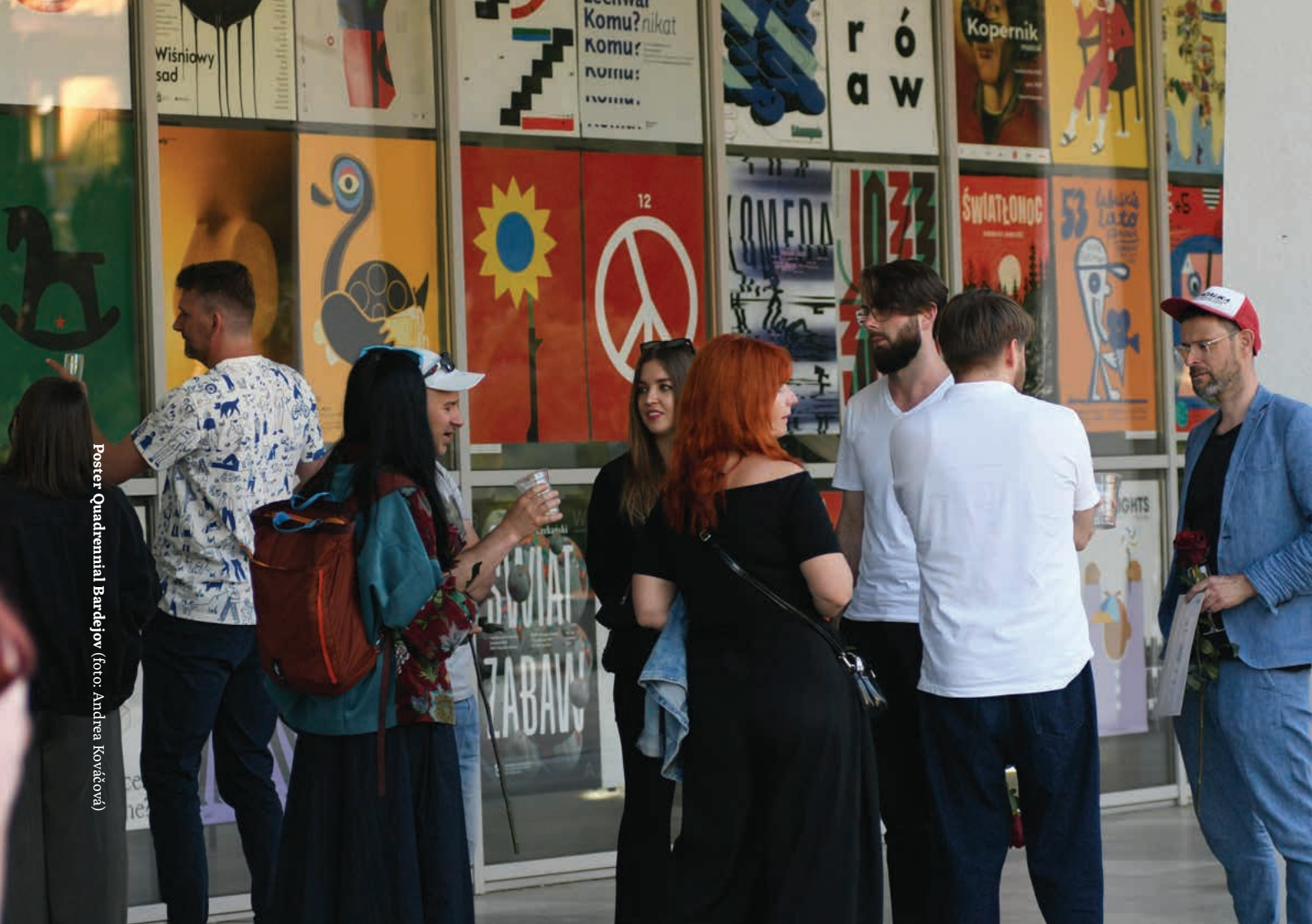
Poster Quadrennial Bardejov