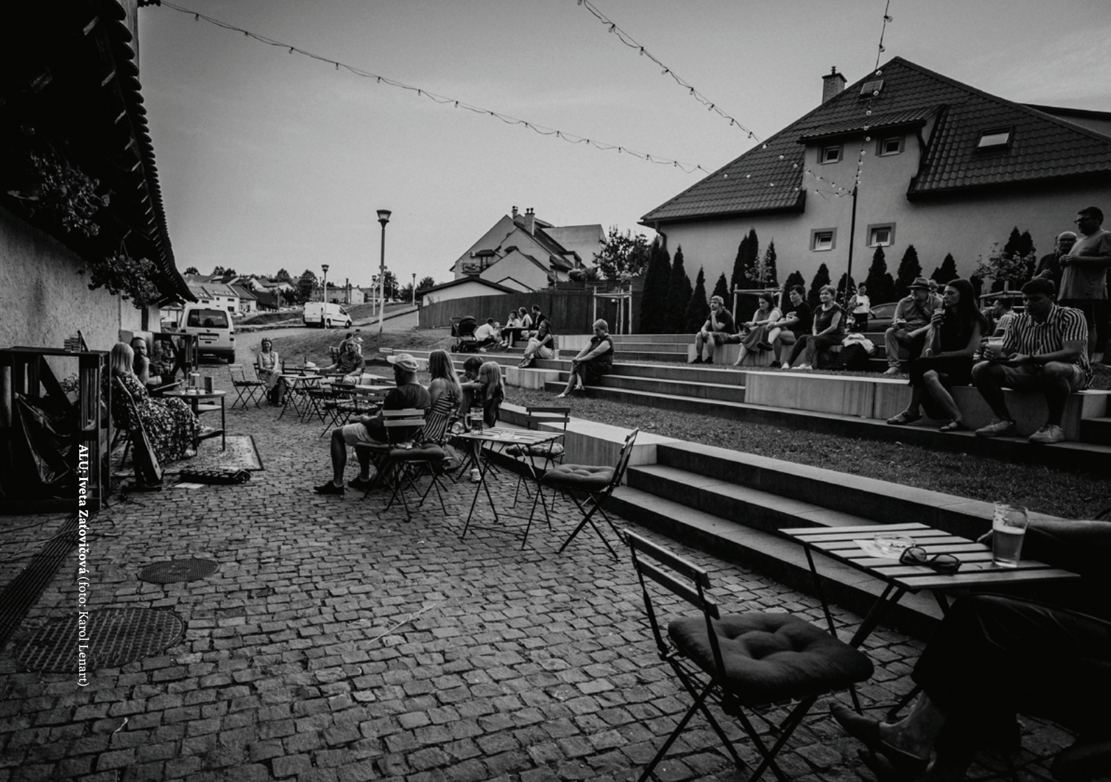
AlŮ: Iveta Zatořičová