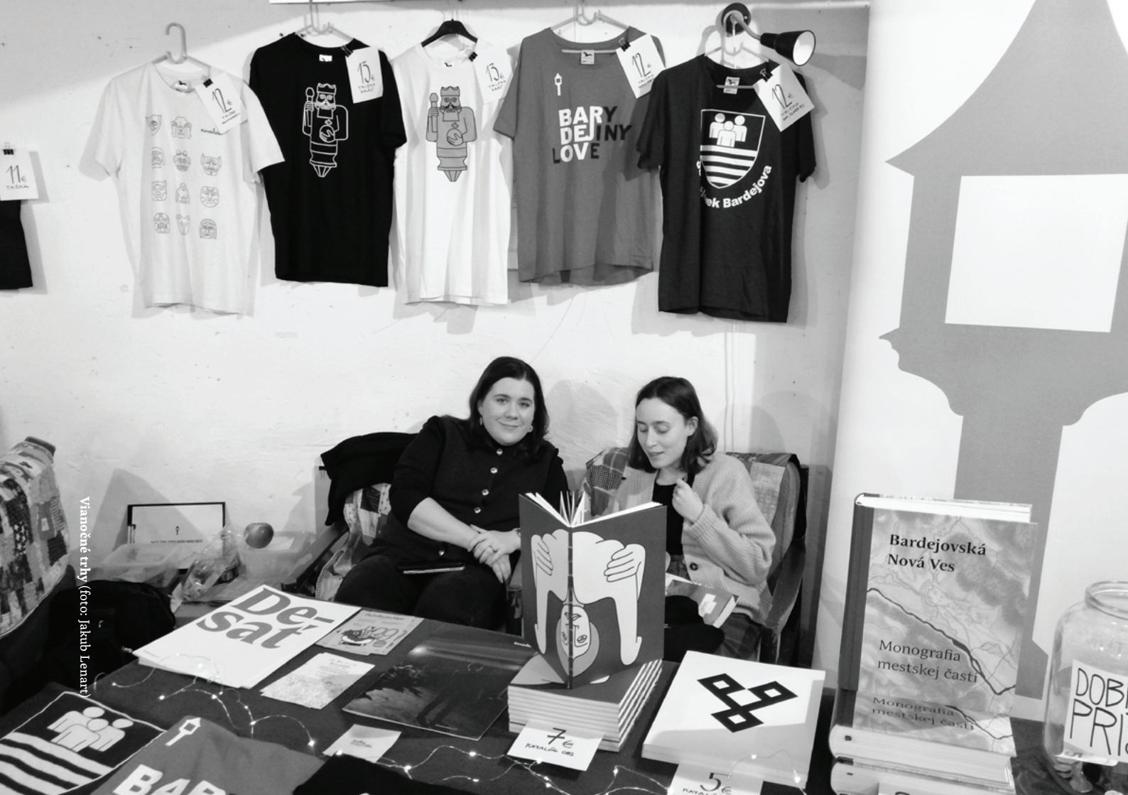
Vianočné trhy